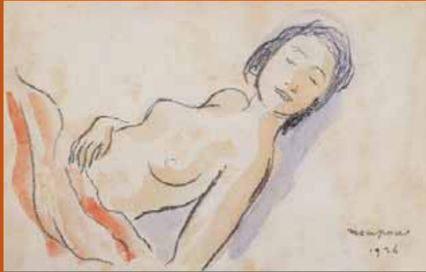
Josep Mompou i Dencause Tors de noia adormida, 1926 Llapis gras i aquarel·la sobre paper. 15 x 23,3 cm