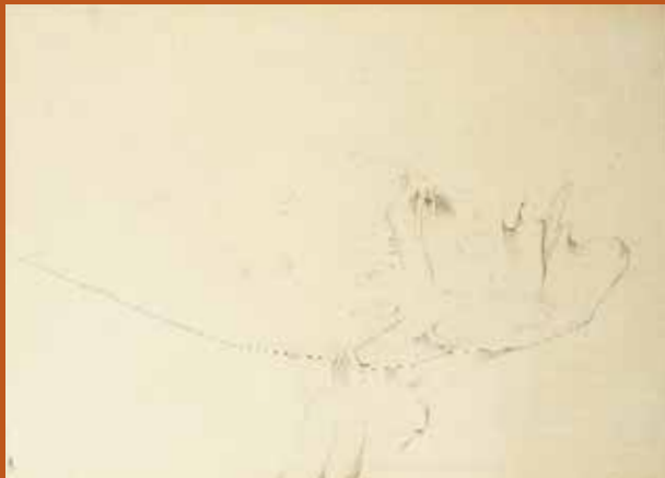
Joan Ponç Cap d'arlequí, 1958 Llapis plom sobre cartolina. 50,5 x 69,5 cm