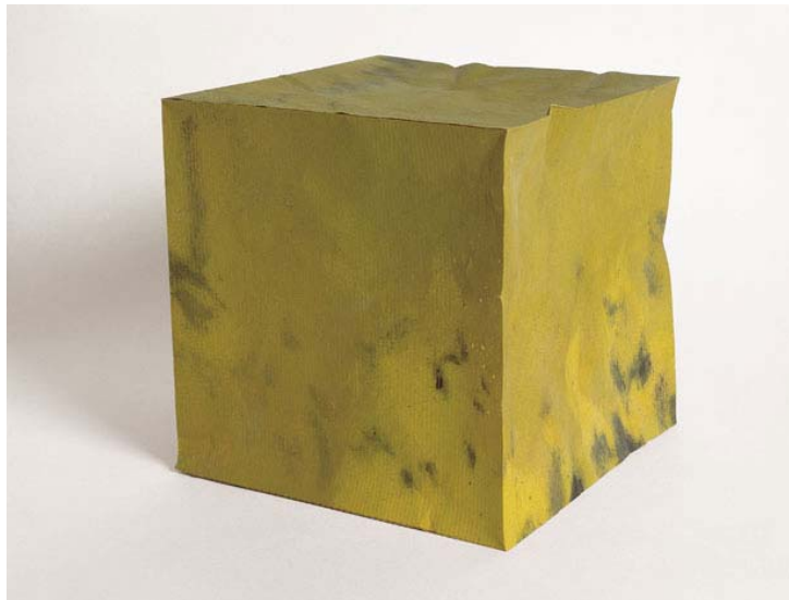
Àngel Jové/Antoni Llena, Escultura doble , 1968