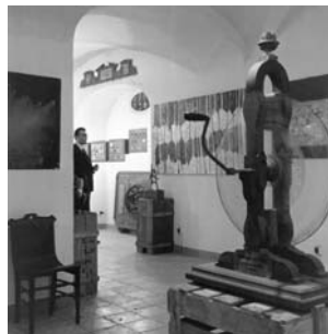
Vista de l'exposició Machines , Galeria Lleonart, Barcelona, 1964