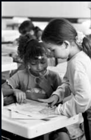
Porto Alegre (Brasil)

Fills de pares enfrontats en la guerra, ens recorden la importància de l'amistat per sobre de les diferències de tipus cultural o religiós.