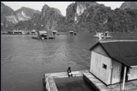
Badia d'Halong (Vietnam)

La realitat de moltes famílies en les quals, d'una manera o d'altra, i gairebé de manera natural, és escollit el rol de qui podrà gaudir de l'educació escolar; els altres membres de la família hauran de vetllar pels més petits.