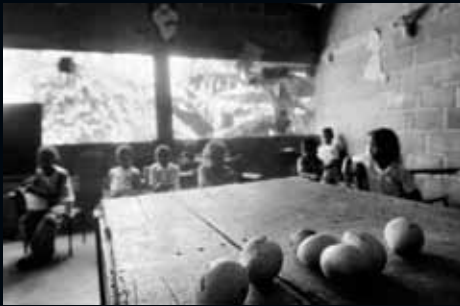
Rio Viejo (Colòmbia)

En aquesta imatge se'ns mostra l'únic alumne que ha estat seleccionat per la comunitat, el qual es convertirà en el dipositari i futur transmissor del coneixement acadèmic.