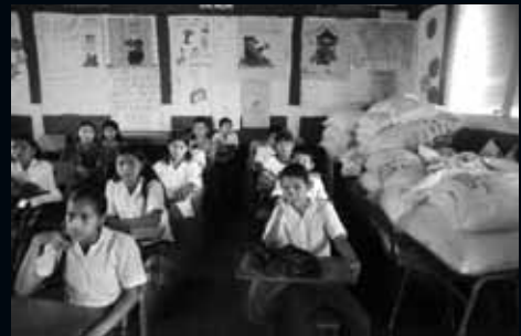
Ahuachapán (El Salvador)

Sovint, a les escoles d'aquests països, els estudiants reben part de la seva base nutritiva a través de programes de solidaritat. Aquesta fotografia constata que l'assistència a l'escola de molts alumnes és motivada per aquest fet. Probablement, aquesta és la seva única font d'alimentació.