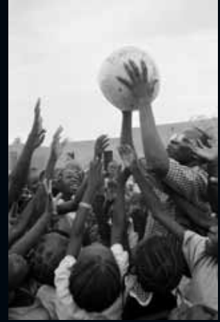
Ouagadougou (Burkina Faso)

Està escrit en la tradició oriental, penjar al vent els pensaments que altres poden fer seus. La cultura com a bé comú.