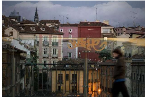
Madrid des de l'aqüeducte