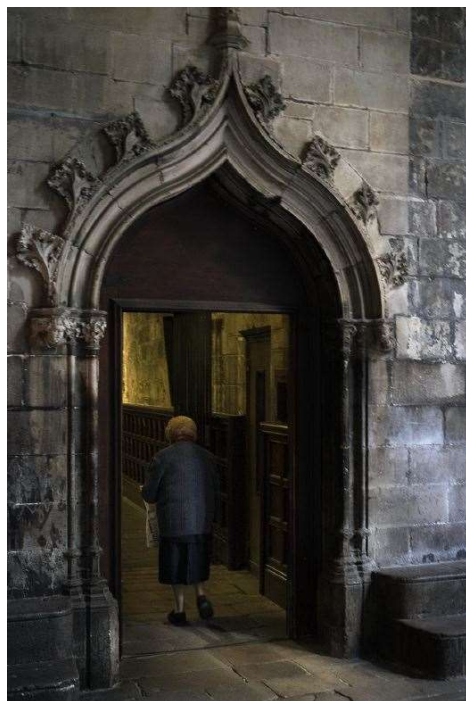
Entrada a la Catedral