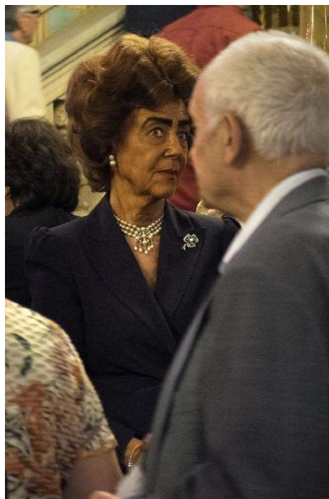
Dona al Palau de la Música