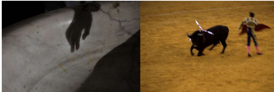
Pila baptismal on va ser batejat Pablo Picasso.

“A Picasso el van acaparar des de petit la proximitat del Mediterrani —que després ell va reinventar tan sàviament poblant-lo de monstres i d'amants—, els colomers del seu pare —amb un simple aleteig del burí, va convertir els coloms en símbol de la pau— i la ferocitat del toro al bell mig de la plaça...”