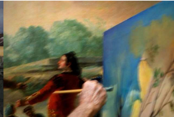
Copista del Prado