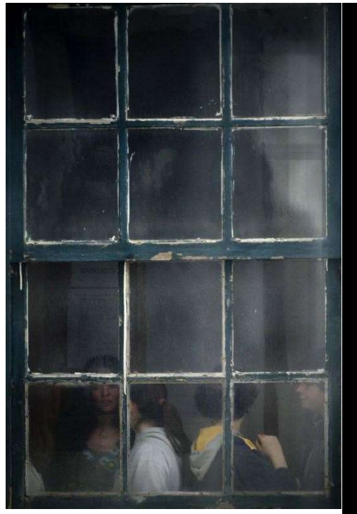
Instituto Da Guarda. Torre de Caramelo

“La Torre d’Hèrcules era un dels llocs predilectes d’en Pablo; apareix en un dels seus millors olis de la Corunya. Tothom sap que a les grutes marines que envolten el far hi ha una de les millors fàbriques de vent del món, i allà és on anava el jove Picasso a veure néixer el vent..”